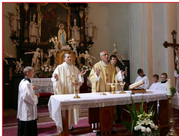
Duchovní otcovia