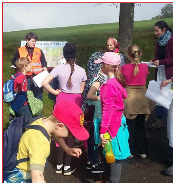
Jedna z prvých zastávok na Mariánskej hore

Máme pred sebou dlhú cestu. Nepoznám lepší spôsob, ako sa zabaviť, než si z plných pľúc poriadne zaspievať. Cesta nám plynie veľmi hladko. Deti učíme nové ukazovačky a samozrejme fotografujeme - deti a majestátne Vysoké Tatry, ktorých sa nemôžeme nabažiť. Po hodinke a pol schádzame z diaľnice a vstupujeme do centra Levoče. Autobus prišiel do cieľovej destinácie, parkovisko pri zimnom štadióne.