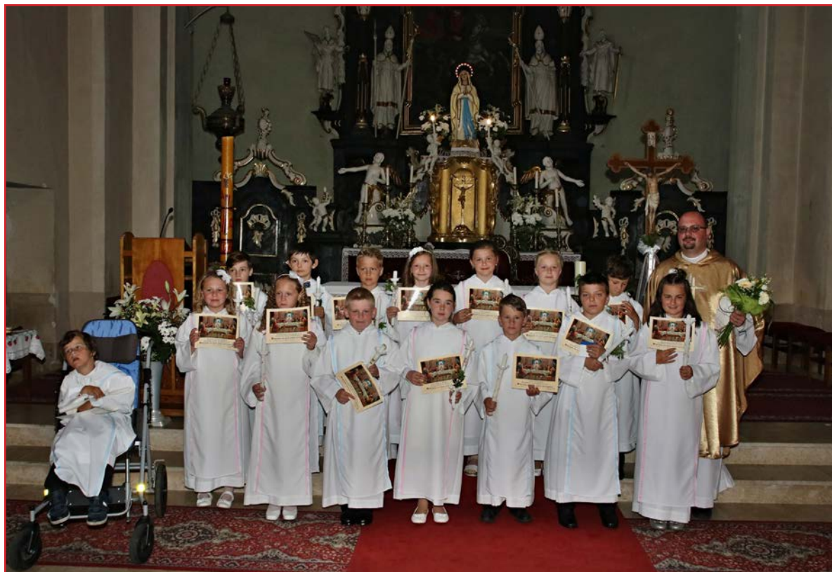
Prvoprijímajúce deti