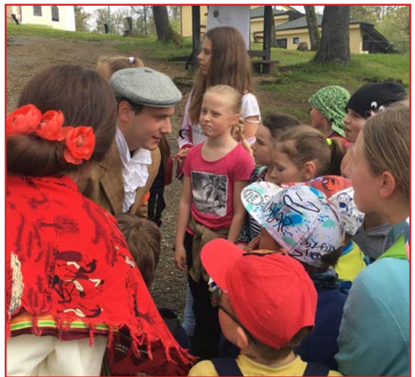
Pod vrcholom Mariánskej hory

a napokon sme na malý lepiaci papierik napísali, za koho chceme obetovať dnešnú púť. Už sme videli vrchol baziliky. Vedeli sme, že sme blízko. Čakalo nás už len niekoľko zastávok. Jedna z nich bola ružencová, kde sme si zopakovali jednotlivé tajomstvá a desiatky svätého ruženca, a druhá, posledná, nám prezradila celý príbeh a boli nám vysvetlené všetky indície. Na úplný vrchol sme dorazili štvrtí. Zozbierali sme hygienické potreby a suché potraviny - obetné dary.