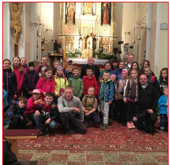
Po skončení svätej omše