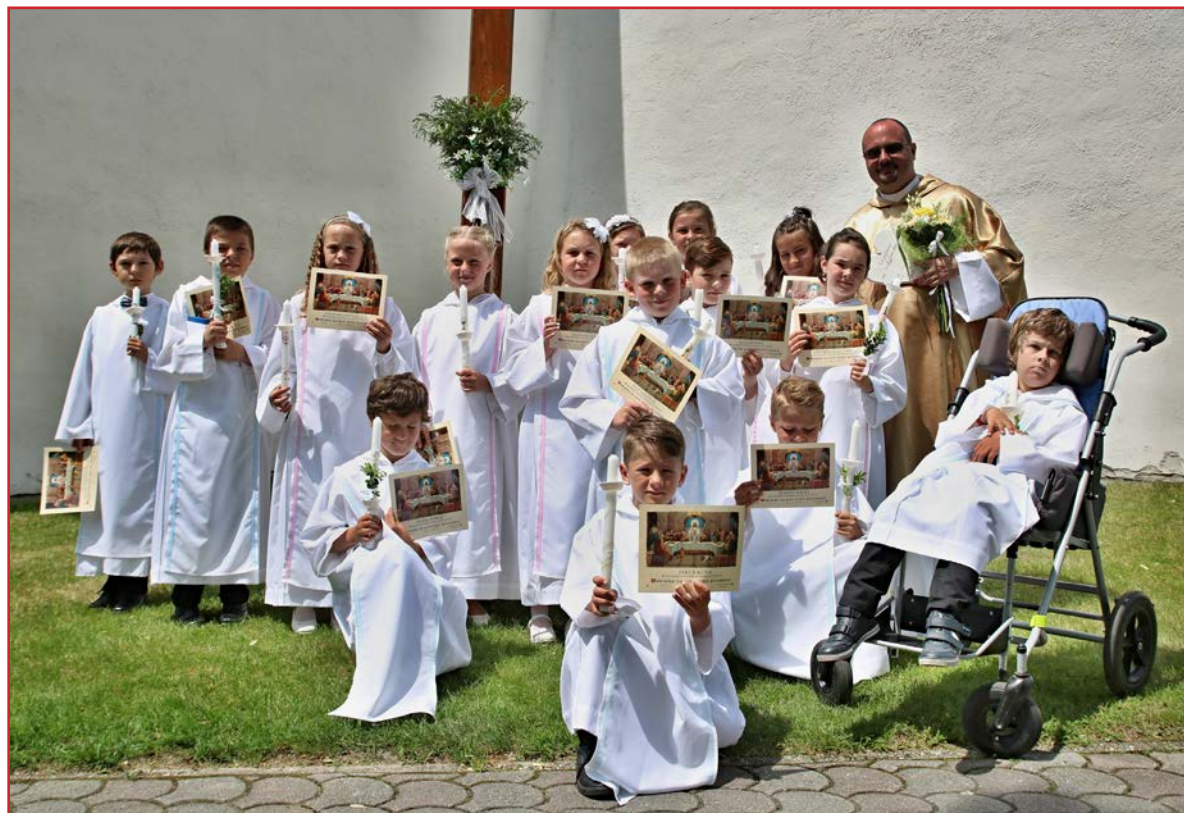
Prvoprijímajúce deti