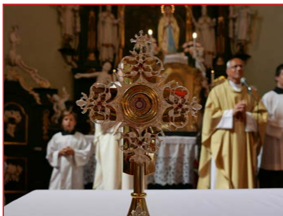
Relikvia s krvou svätého Jána Pavla II.