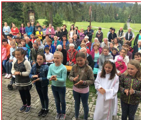
Prvoprijímajúce deti počas svätej omše