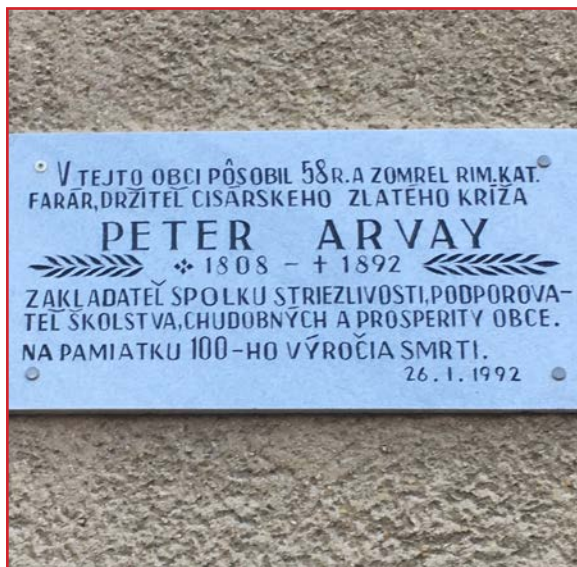
Tabuľa venovaná Petrovi Árvayovi umiestnená na farskom úrade