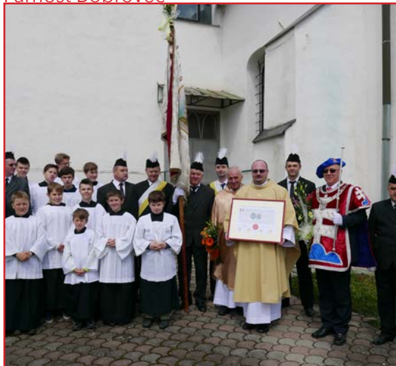
Po skončení odpustovej svätej omše