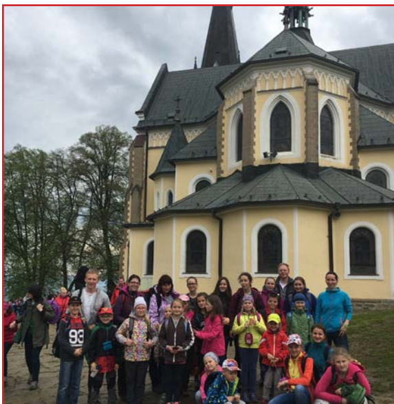
Pred odchodom domov